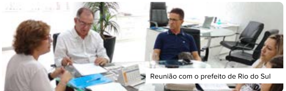
Reunião com o prefeito de Rio do Sul

O ano de 2025 iniciou com a troca de governos em todos os municípios do país. Os novos gestores, eleitos em 2024, assumiram seus cargos e os desafios da gestão municipal. Diante disso, o Sinspurs deu início a uma série de reuniões com prefeitos, vice-prefeitos e secretários municipais que assumiram as respectivas pastas. A intenção é estabelecer diálogo com as novas gestões, colocando o sindicato à disposição para buscar melhorias nas condições de trabalho e na valorização dos servidores. O Sinspurs também reforçou os itens da pauta de negociação estabelecida em assembleias e que compõe a mesa de negociação iniciada no final de 2024 com as gestões anteriores. Algumas dessas reuniões já resultaram em avanços em itens importantes da pauta.